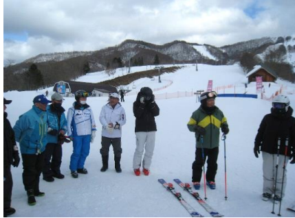
例会担当から「今日のテーマは・・・」