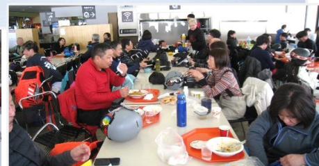
レストラン「スカディ」皆で食事