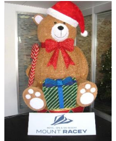
レースイの マスコット