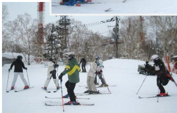
しっかり準備運動