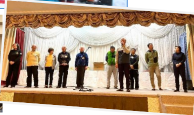
壇上でクラブ紹介