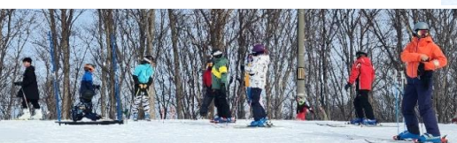
ゲート前で順番待ち