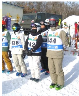
実技前のミーティング