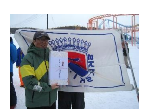
特別賞を手に H田さん