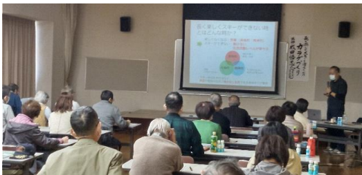
大麻西地区センター会議室