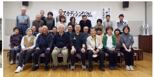
講師を真ん中に記念撮影