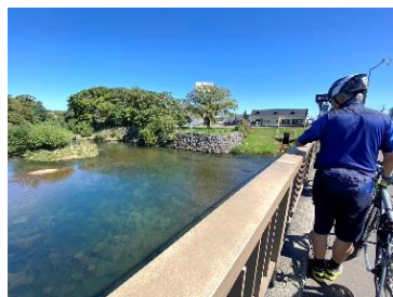
千歳川 鮭がうじゃうじゃ